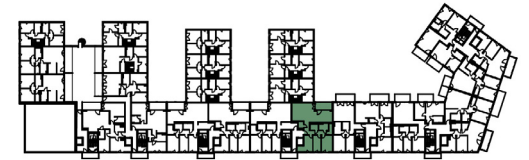
In den Diken